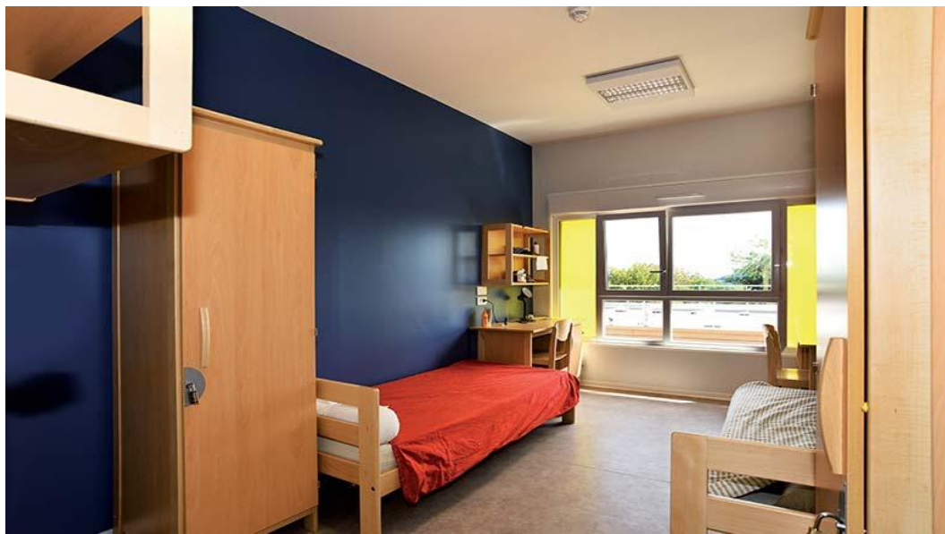
Exemple de chambre pour les étudiants en 2 ème année. (Bâtiment M)