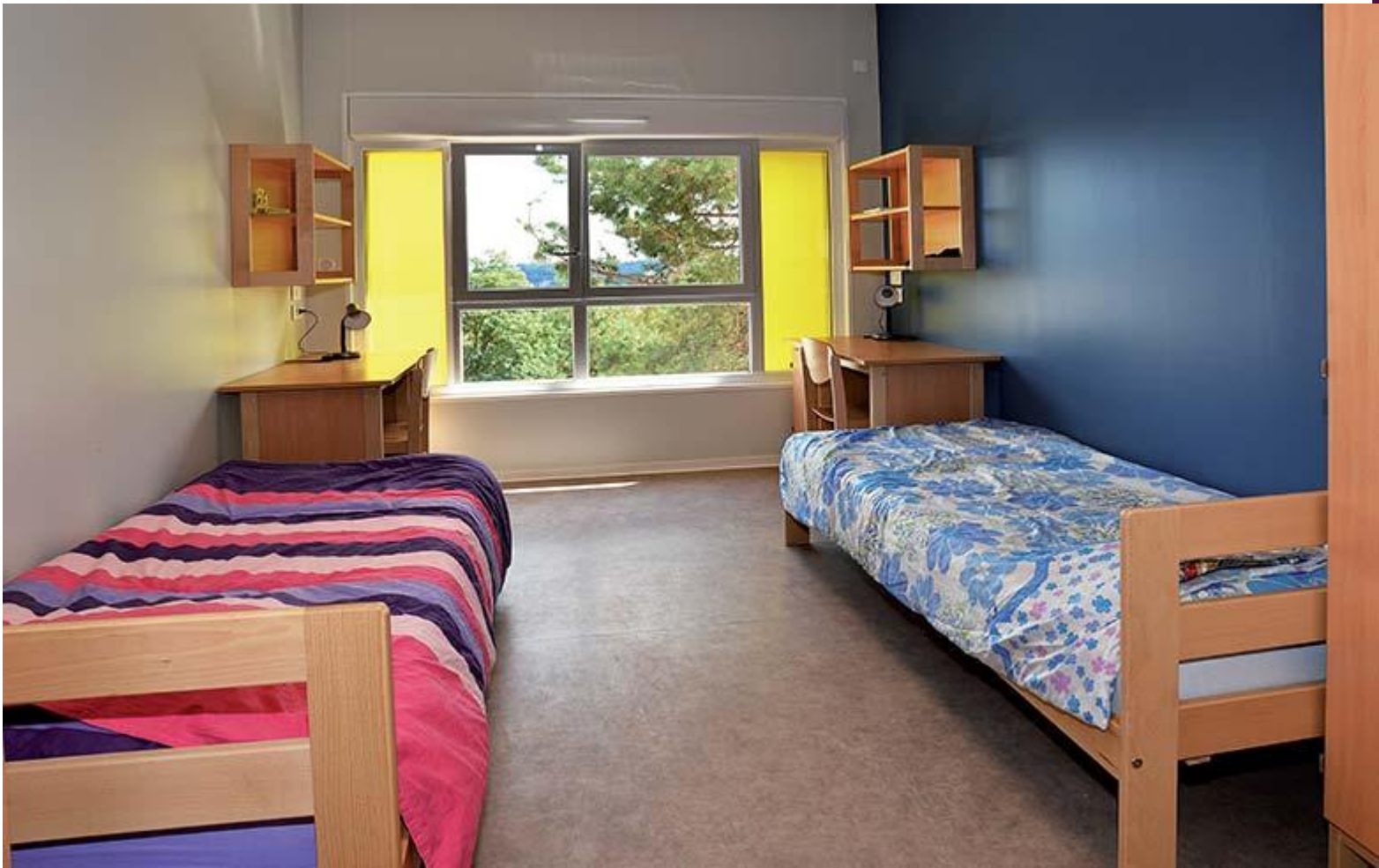
Exemple de chambre pour les étudiants en 2ème année (Bâtiment M)