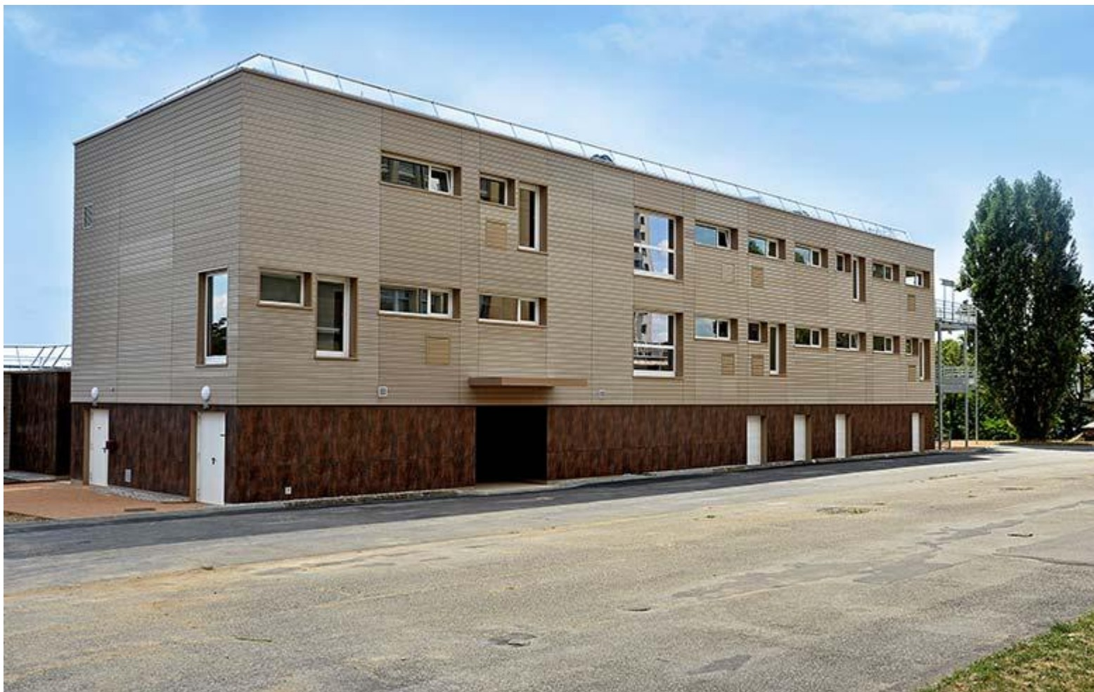
Vue extérieure du bâtiment M (étudiants de 2 ème année).