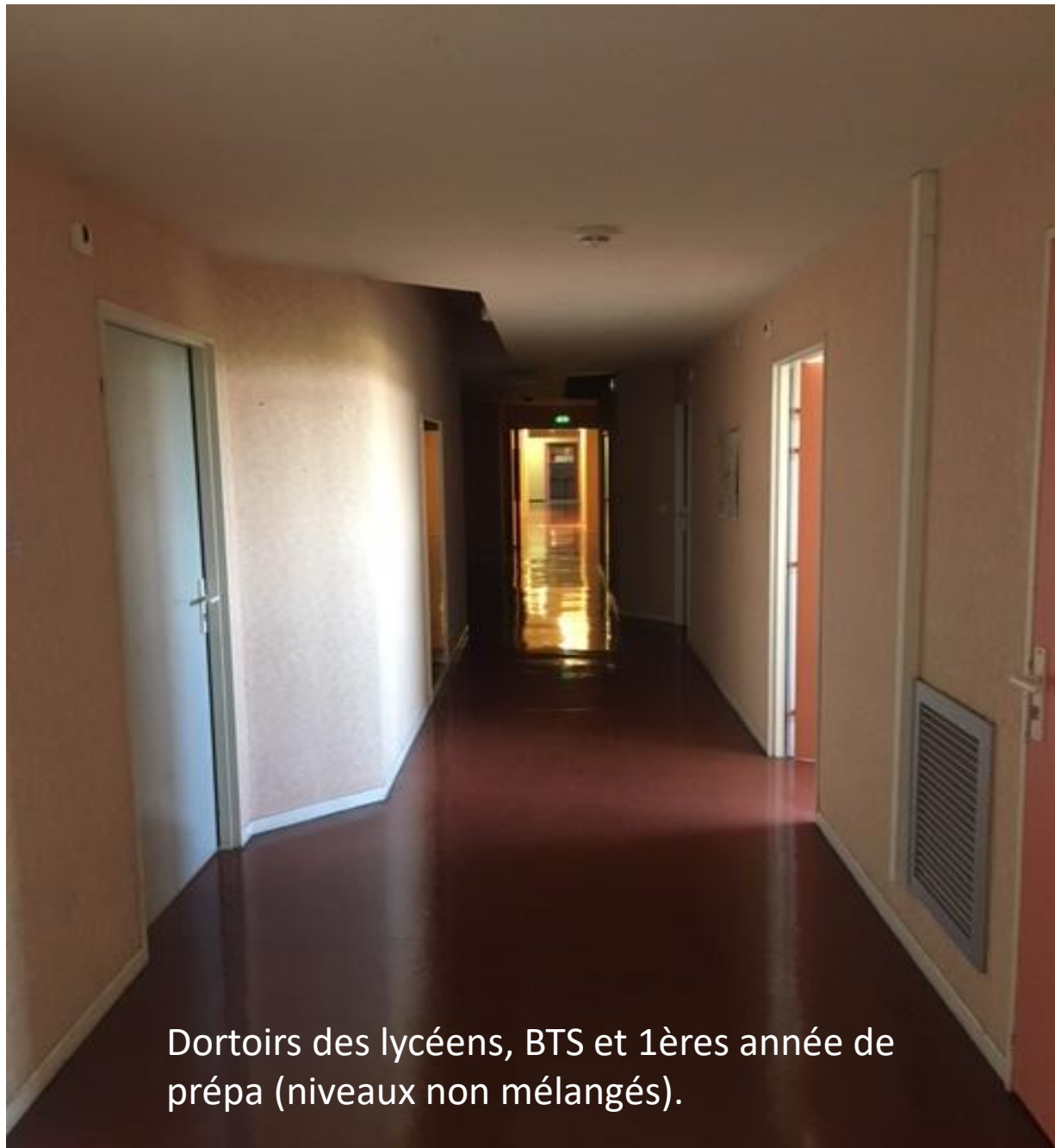
Dortoirs des lycéens, BTS et 1ères année de prépa (niveaux non mélangés).