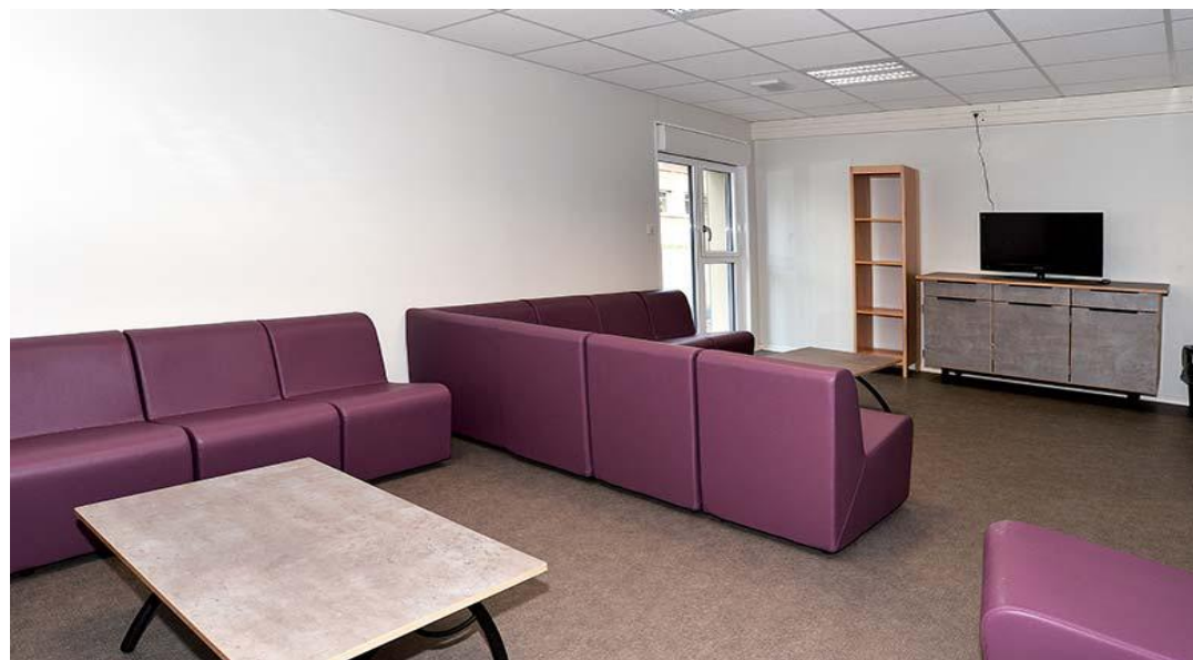
La salle TV du bâtiment M (étudiants de 2 ème année ).