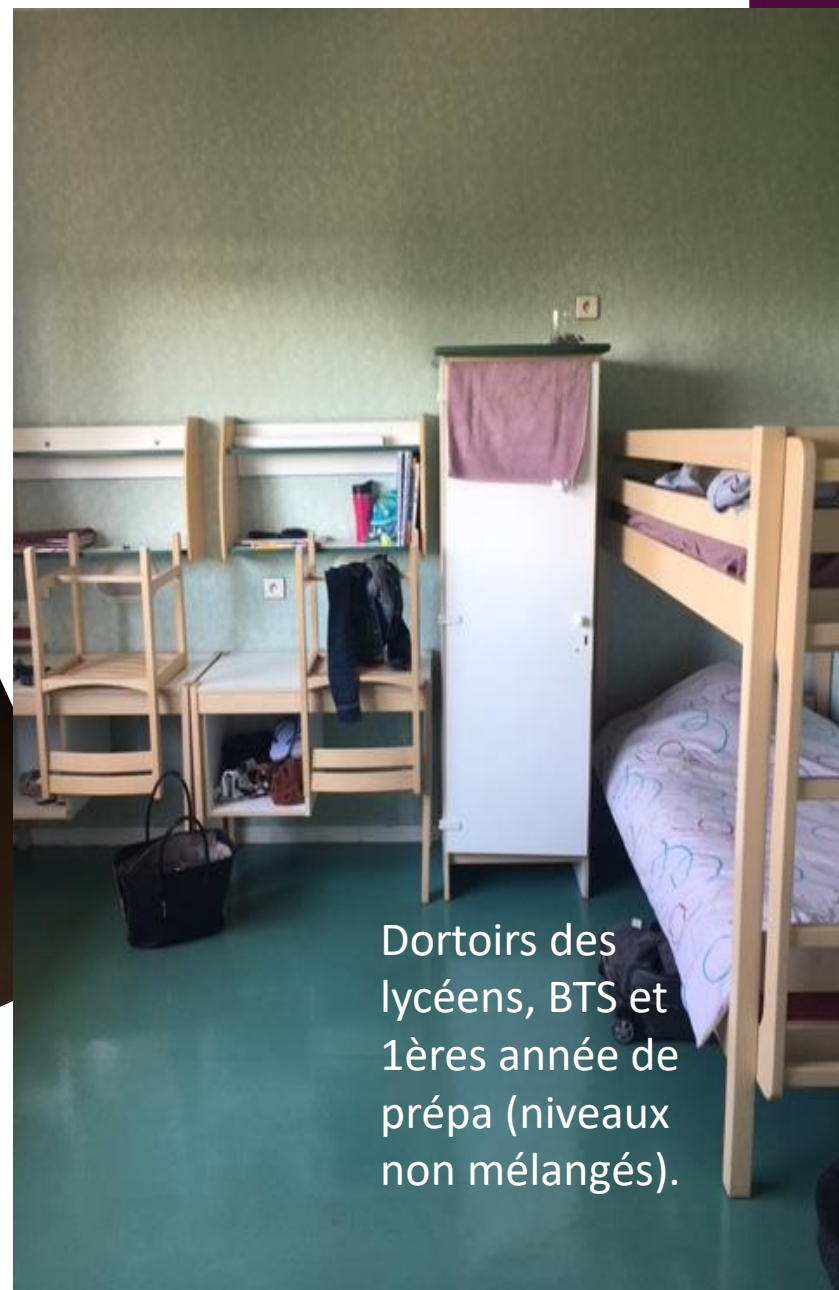
Dortoirs des lycéens, BTS et 1ères année de prépa (niveaux non mélangés).