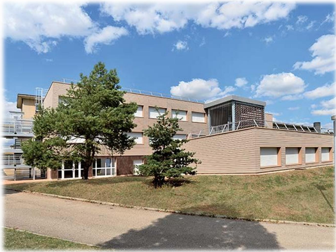
Vue extérieure du bâtiment M (étudiants de 2 ème année).